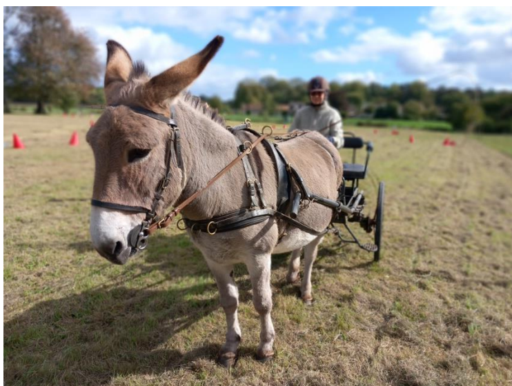
-Stage 22 et 23 mars 2025 Valérie et Bertrand RATAUX